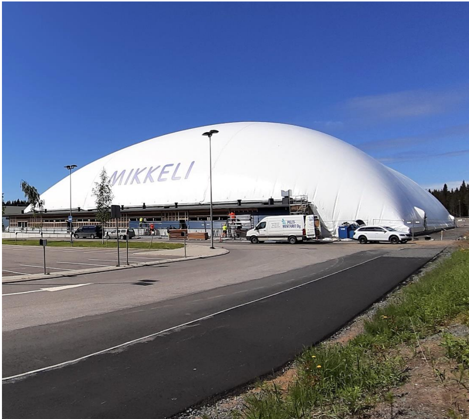
Kuva: Kalevankankaan jalkapallohalli